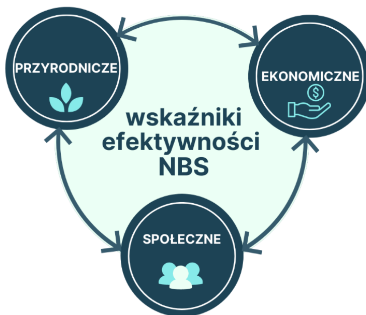
Rysunek 1. Diagram obrazujący wskaźniki efektywności rozwiązań opartych na przyrodzie oraz wzajemnych relacji pomiędzy nimi

Celem pracy była analiza możliwości wykorzystania różnorodności biologicznej jako wskaźnika efektywności wdrażania wybranych NbS oraz określenie wzajemnych relacji pomiędzy wskaźnikami społecznymi, ekonomicznymi oraz przyrodniczymi przy wdrażaniu rozwiązań opartych na przyrodzie w różnych skalach przestrzennych (Rys. 1).